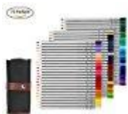
Buntstifte 2 Linkshänder- in Federtasche