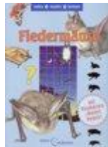
Fledermäuse – Das Mitmachheft