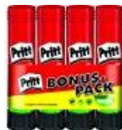
farbiges Papier Klebestifte