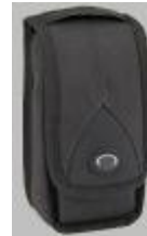
SSF BAT2-Detektor Tasche Detektor